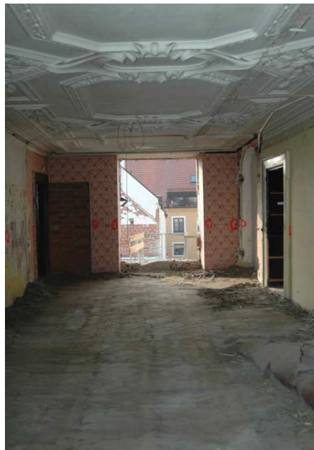
Stuckdecke / Stb.-Rost