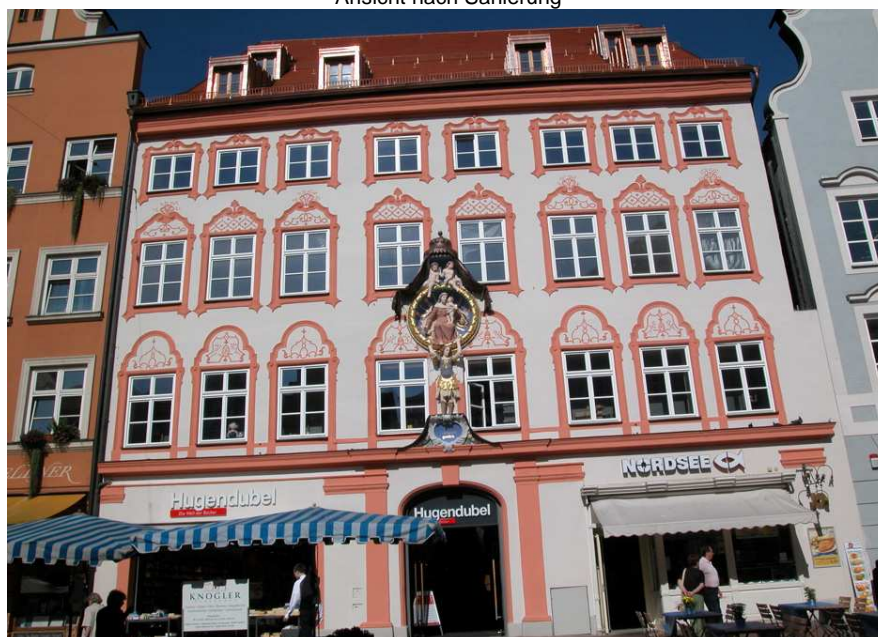
Ansicht nach Sanierung